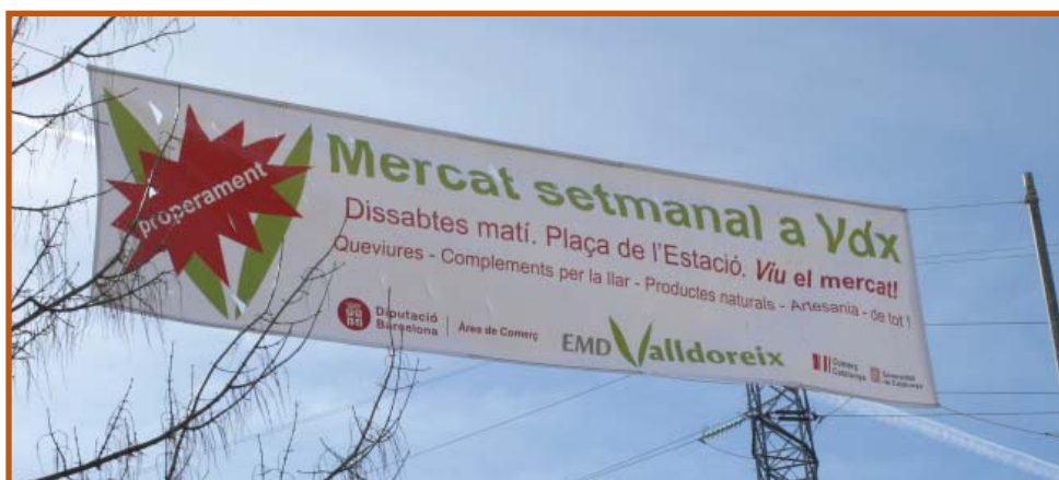
MERCAT SETMANAL: L'ANUNCI JA ONEJA PROMETEDOR

"Tot ja està previst i a punt per gaudir ben aviat del Mercat Setmanal de Valldoreix"