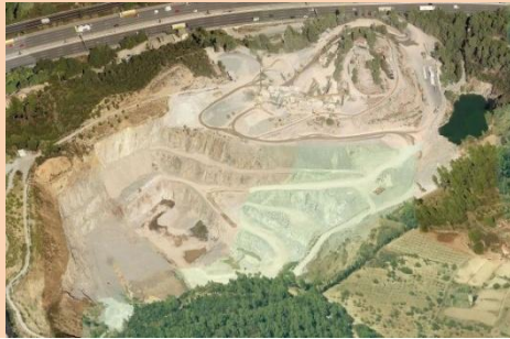
PEDRERA BERTA, TOCANT LA B-30

Celebrem que tant l'Ajuntament de St. Cugat com l'EMD de Valldoreix s'hi oposin i hagin presentat al·legacions.