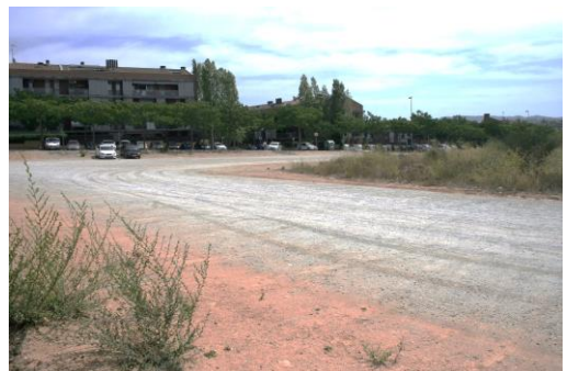
Terrenys de Can Cabassa prop l'Hospital General

Els veïns de Can Cabassa van presentar a finals de 2015 un contenciós administratiu per oposar-se a aquest planejament.