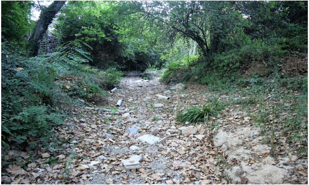
Mal estat actual de les rieres que exigeixen un pla de clavegueram

Queda pendent la solució de totes aquelles zones verdes que han demanat l'expropiació i no estan incloses en la modificació del PGM.