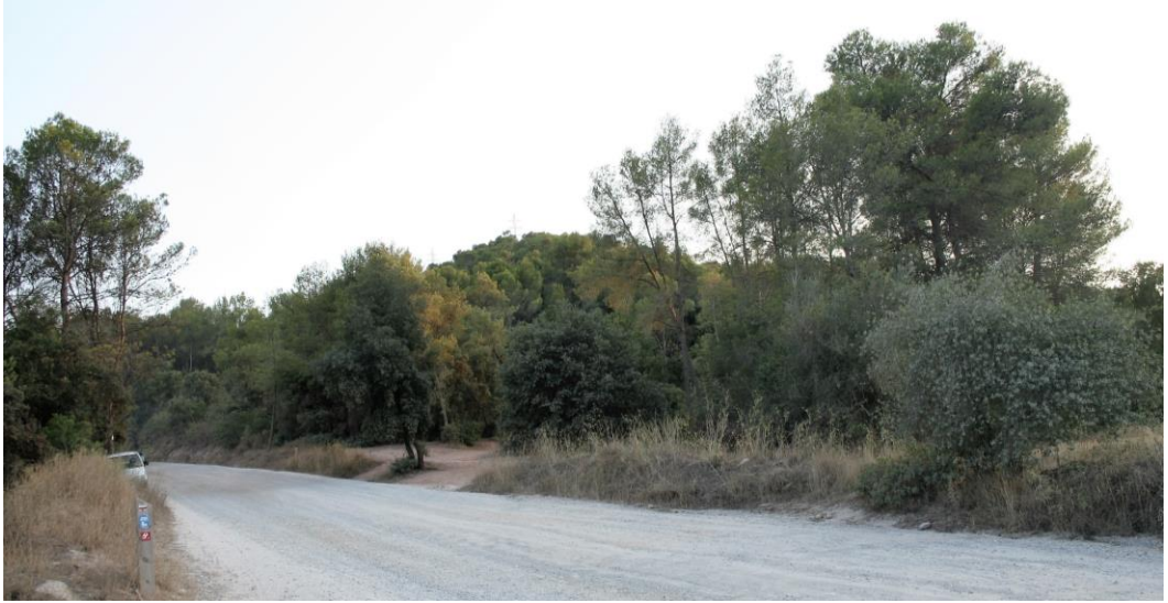
Zona de Can Monmany, camí de la Salut

Aquestes dues operacions ens han costat a tots 2,5 milions d'euros.