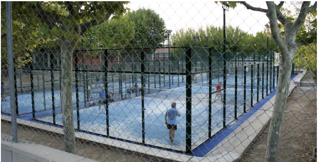
Pistes de pàdel al Centre poliesportiu de l'EMD de Valldoreix

Veïnes Progressistes de Valldoreix (AVVPV) i el vocal d'ICV i portaveu de la Candidatura de Progrés i Catalanista de Valldoreix (CPCV) vam considerar que aquest canvi era tan substancial que no suposava una renovació del contracte, sinó una