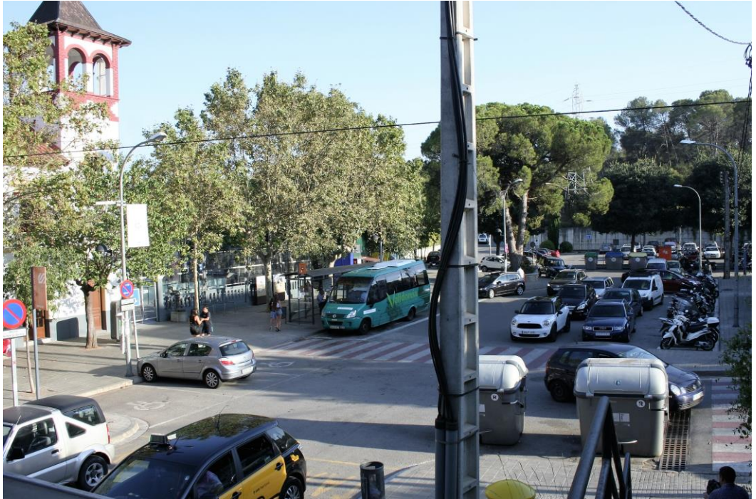
Espai davant l'Estació, que canvia substancialment en la modificació del PGM

A part de l'evident pèrdua patrimonial per a l'EMD, aquesta també perd l'aprofitament derivat de la construcció dels habitatges.