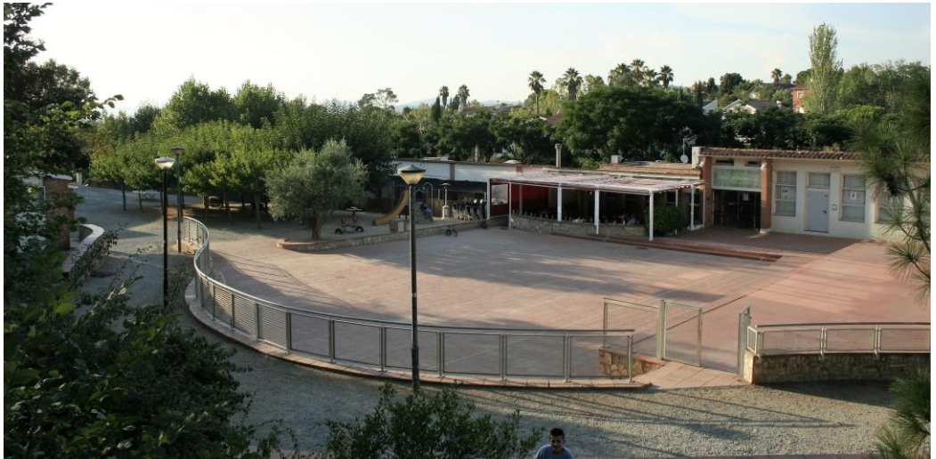
La nova centralitat anirà a la Plaça del Casal i voltants

en sabem res més. S'hi està treballant? A quin nivell? Quan s'informarà al Consell de la Vila?